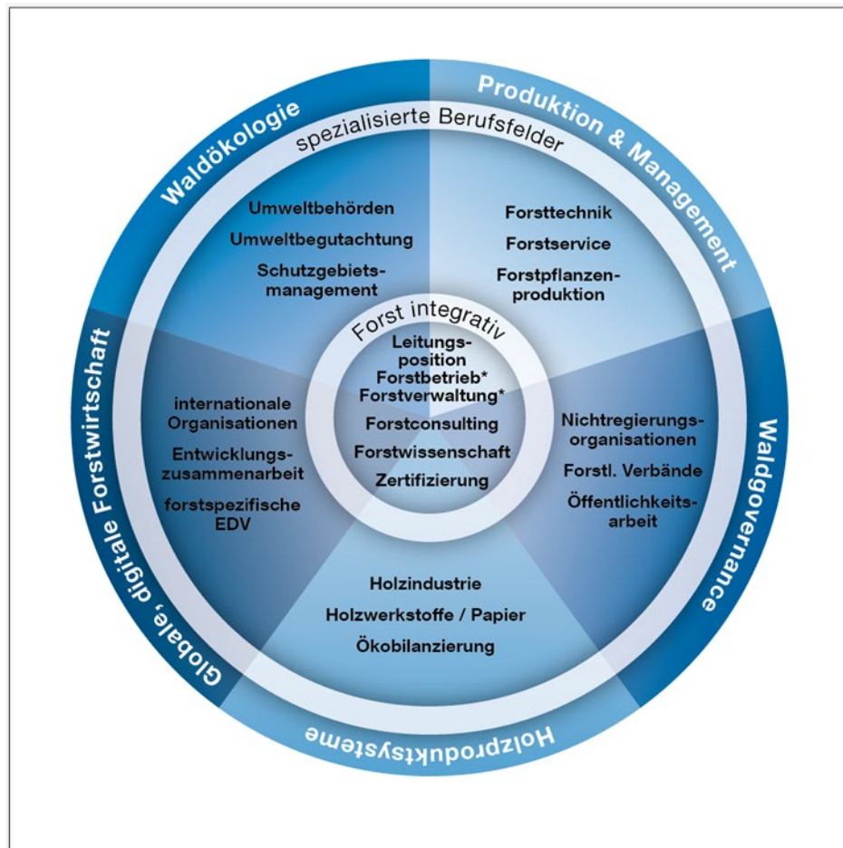
Abbildung 1: Überblick über die wichtigsten integrativen und spezifischen Berufsfelder für Absolventen des MSc Forst- und Holzwissenschaft mit exemplarischen Tätigkeitsbereichen (* in der Regel Große Forstliche Staatsprüfung (QE4) als Zusatzqualifikation erforderlich)

In den beispielhaft genannten Berufsfeldern besteht ein zunehmender Bedarf an akademisch ausgebildeten Expertinnen und Experten mit den im Studiengang vermittelten forst- und holzwissenschaftlichen Kompetenzen. Für die in Abbildung 1 als integrativ bezeichneten Berufsfelder werden Fachleute nachgefragt, die die komplexen Abläufe beim Management, der Zertifizierung und der wissenschaftlichen Untersuchung von Waldökosystemen kennen und in den berufsspezifischen Aufgabestellungen berücksichtigen können. Für die komplexen Zukunftsaufgaben im Zusammenhang mit dem Wald- und Holzmanagement werden Fachleute gesucht, die durch das im Studienangebot vermittelte generalistische Wissen kompetent und effizient vorbereitet sind, um sich vertiefte Expertise für die Lösung neuartiger Fragestellungen anzueignen und diese bei der Problemlösung umzusetzen. Die Studieninhalte und die Wahlfreiheit des Masterprogramm erlauben es Absolventinnen und Absolventen aber auch, individuelle Schwerpunkte zu setzen und im Studium ein Fachprofil zu entwickeln, welches die Qualifikationsanforderungen für leitende und gestaltende Positionen in den spezialisierten Berufsfeldern abdeckt.